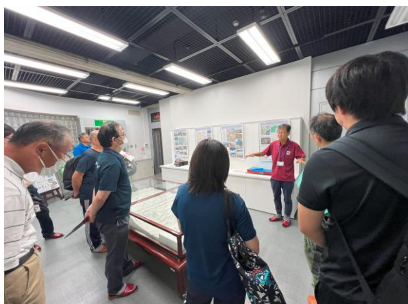
第2回研究協議会の様子(十勝岳火山砂防情報センター)