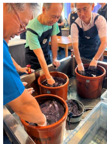
第2回研究協議会の様子(結いの杜)