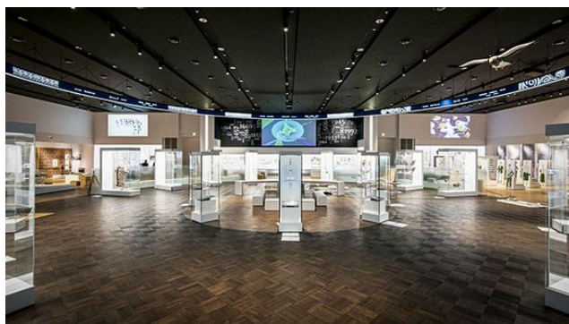
国立アイヌ民族博物館外観(左)と基本展示室(右)